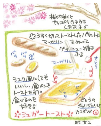
<茶山台・ちこさん>

★今春も恒例のピカピカ新1年生の入学式があります。どの子も可愛くてたまりません。子どもは社会の宝です。みんなで大いに祝福しましょう。(御池台・M.Nさん)