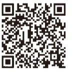
応募はこちらから