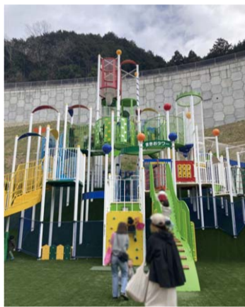
こちら情報センター

てきました=写真下。この日は午後から雨模様の予報でしたが、親子連れが…次から次へと。写真は撮れませんでした。小さなグラウンドや、ボルダリングができる施設もありました。この日は駐車場も満車で、付近の道は一方通行になっていました。また、駐車場は公園の場所と離れていたり、階段がある所もあります。(あおちゃんさん)