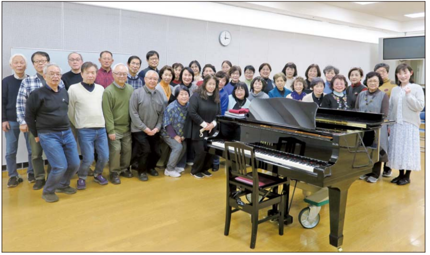
泉北混声合唱団の皆さん