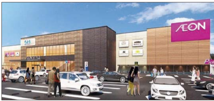
「そよら金剛」のイメージ図

「そよら」とは「そら、寄って、楽しんでつて」との呼び掛けが由来。イオンモールなど郊外型ショッピングセンターとは一線を画し、普段の買い物や用事が出来る、日常使いの都市型商業施設だ。食品スーパーの会を開催している。当日は、近隣の高齢者や子ども連れの母親などが参加し、和紙やクラフトテープで結び雛を作った。