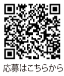
応募はこちらから

【応募方法】●住所・氏名・電話番号・年齢を記入し、ハガキまたはFAX、メールで。4月9日（火）必着。抽選で3人にギフト券（千円）を進呈●〒590-0105南区竹城台3丁22番2号、コミュニティ・クロスワード係（FAX072-291-5473、メールhomecommunity2525.com）●答と当選者発表は4月18日号●応募ハガキの余白に必ず投稿を1身の回りの出来ごと、イラストなど。ホームページや紙面に掲載します。 ★出題歓迎。採用分にはクオカード進呈。毎月2週目に前月分をまとめて発送します。