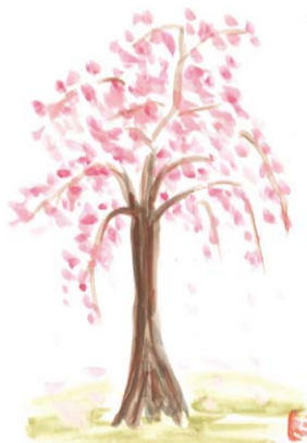
<榎塚台・リキタンさん>

★今年は寒暖の差が激しく、暖かくなって一気に開花するかと思いきや、急に寒くなったりで、桜も咲こうか咲くまいかと迷っているのではないのでしょうか。でも、そろそろちらほら咲き始めていますね。長雨で花見をする前に散ってしまったというようなことがなければいいのですが。(はつが野・J.Kさん)