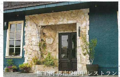
施工例 堺市泉田中 レストラン