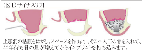
(図1) サイナスリフト 上顎洞の粘膜をはがし、スペースを作ります。そこへ人工の骨を入れて、半年待ち骨の量が増えてからインプラントを打ち込みます。

サイナスリフトは、上顎洞に骨を入れて増やす方法です。上顎洞は、鼻の一部で普段の生活で意識することはありませんが、インプラント手術を難症例にする原因の一つです。サイナスリフトの方法は、歯肉切開を行い、インプラントを打ち込む穴から離れた場所に、上顎洞に達する穴を形成します。その穴から、上顎洞に人工の骨を継ぎ足しすることにより、骨の厚みを確保します。