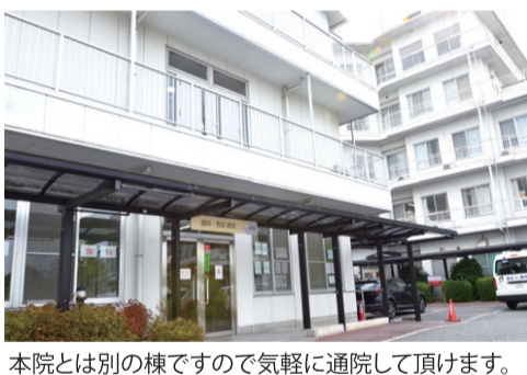
本院とは別の棟ですので気軽に通院して頂けます。