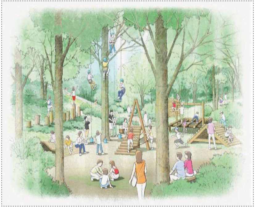
冒険の森のイメージ