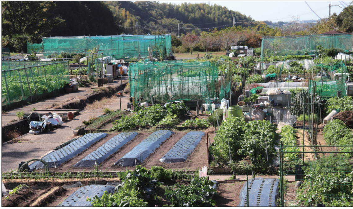
2023年度全国学力調査 平均正答率(公立・%)

季節を歩く会 28日に延命寺の紅葉。10時に南海高野線千早口駅に現地集合。弁当・飲み物持参。無料。雨天中止。 072・294・1786