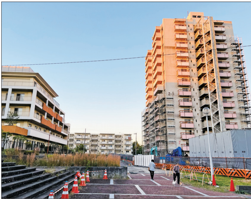
グッドタイムリビング(左)と撤去工が進む高倉台センター住宅(右)

した区域には集客力の高い商業施設、地区中央には地域コミュニティの核となる集会所などを配置予定。泉北高倉台郵便局は同地区内に移転し、既存の高層者マンション「グッドタイムリビング泉北泉ヶ丘」以外は生まれ変わる。 工事は整地・擁壁・雨水管及び汚水管敷設工事、道路整備など。現在の工事進捗状況は仮設道路の新設、下水管敷設工事が行われ、同時に高層階の解体工事も。解体される同住宅は鉄筋コンクリート造り14階。建築面積は450平方メートルで延べ面積は5700平方メートル。 〔横山〕 また、和泉市は10月に一括査定サイト「おいくら」を運営する株式会社マーケットプライズと連携協定を締結した。新たなりユース施策として導入された「おいくら」は、ウェブサイトを通過して不要品の査定依頼をすると全国の加盟リサイクルショップに一括査定依頼がされ買取価格が提示される。買取価格の比較が容易にできるため売却する店舗を見つけやすく、希望すれば出張買取も可能で大型の家具や家電の売却も便利だ。 市はリユース活動を促進し廃棄物の削減を呼び掛けている。 〔高見〕