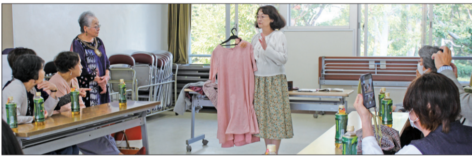
赤坂台5丁集会所で10月22日「第36回カルチャーフェスティバル」が開かれ、近隣住民約100人が来場してにぎわった。

コロナ禍前はファッションショーとして、多くの観客の前で自作の服を自ら着て、モデルさんながらポーズをきめたことも。今回は教室のメンバーだけが集まった世界で一つの服を披露しあった。