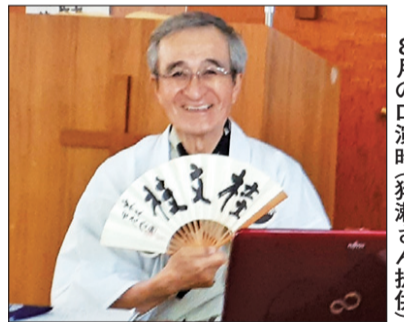
8月の口演時

が26日1時半から、桂米朝の落語「地獄八景亡者戯れ」を口演する。南図書館第1集会室で。8月の初回口演に行けなかった人や、再演を希望する人からのリクエストに応えた。入場無料、定員に達し次第締め切り。