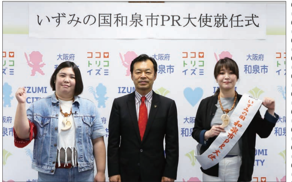
いずみの国和泉市PR大使就任式