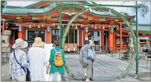
多治速比売神社で6月30