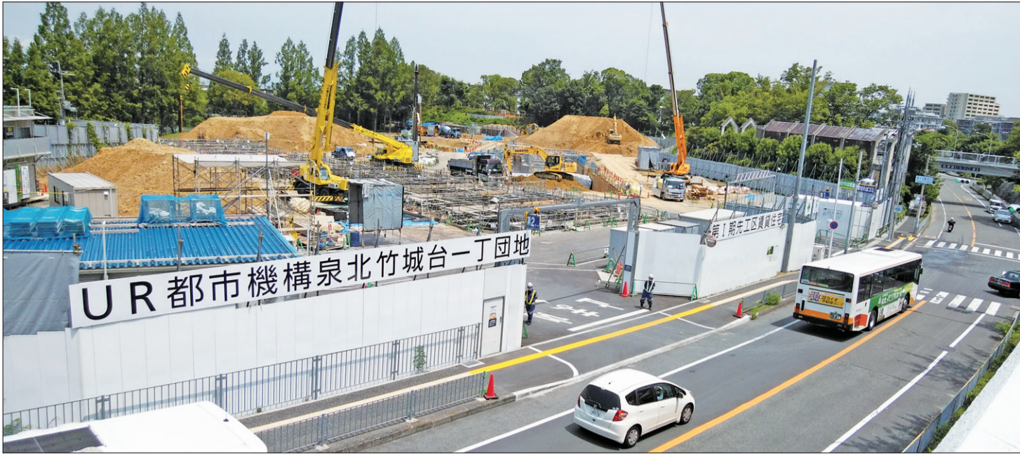
泉ヶ丘駅北側(コノミヤ側)のUR1丁目団地の建て替え