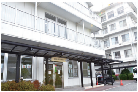
本院とは別の棟ですので気軽に通院して頂けます。