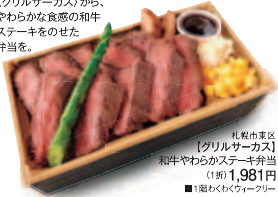
札幌市東区【グリルサーカス】和牛やわらかステーキ弁当 (1折) 1,981円 ■1階わくわくウィークリー