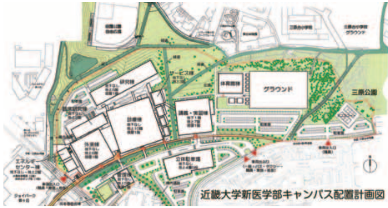
近畿大学新医学部キャンパス配置計画図

説明会で近大は、大阪狭山市の現地で建て替えるという「現状の敷地は丘陵地となっていて平面が少なく、診療を続けながらの建て替えは不可能だと判断した」と説明。一方、泉ヶ丘駅前移転後は「老朽化後は」作