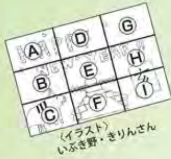
(イラスト) いぶき野・きりんさん