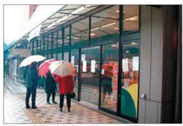
突然の赤坂台アベティートの閉店に驚く客たち(01年3月)