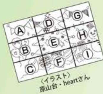
(イラスト) 原山台・heartさん