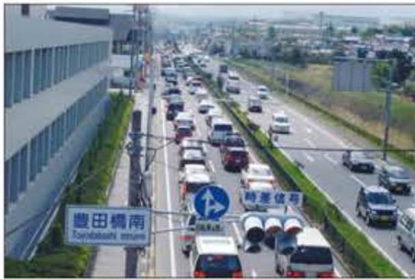
ハーベストの丘に向かう車で大渋滞(00年5月)