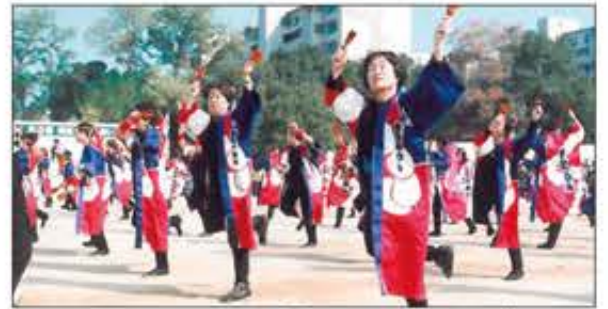
よさこいソーランで盛り上がるふれあい祭り(99年11月)