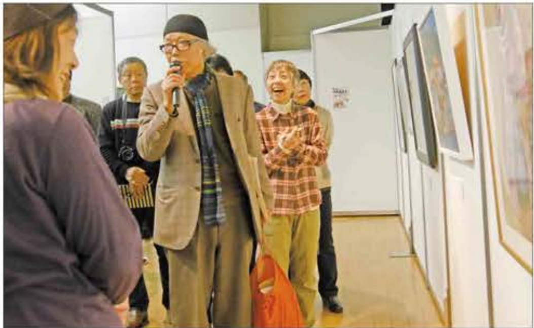
泉北美術展(昨年の様子)