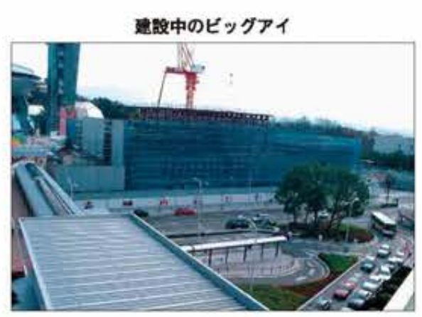
建設中のビッグアイ