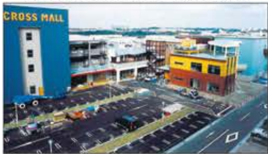
原山台にできたクロスモール(00年12月)