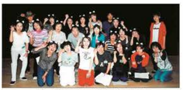
ビッグパンカレッジから生まれた劇団「のらによらい」